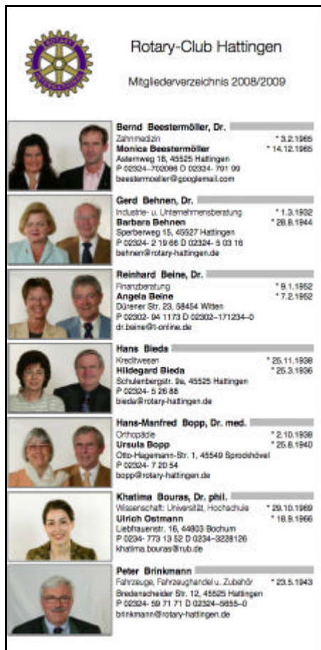
Beispiel eines Mitgliederbüchleins